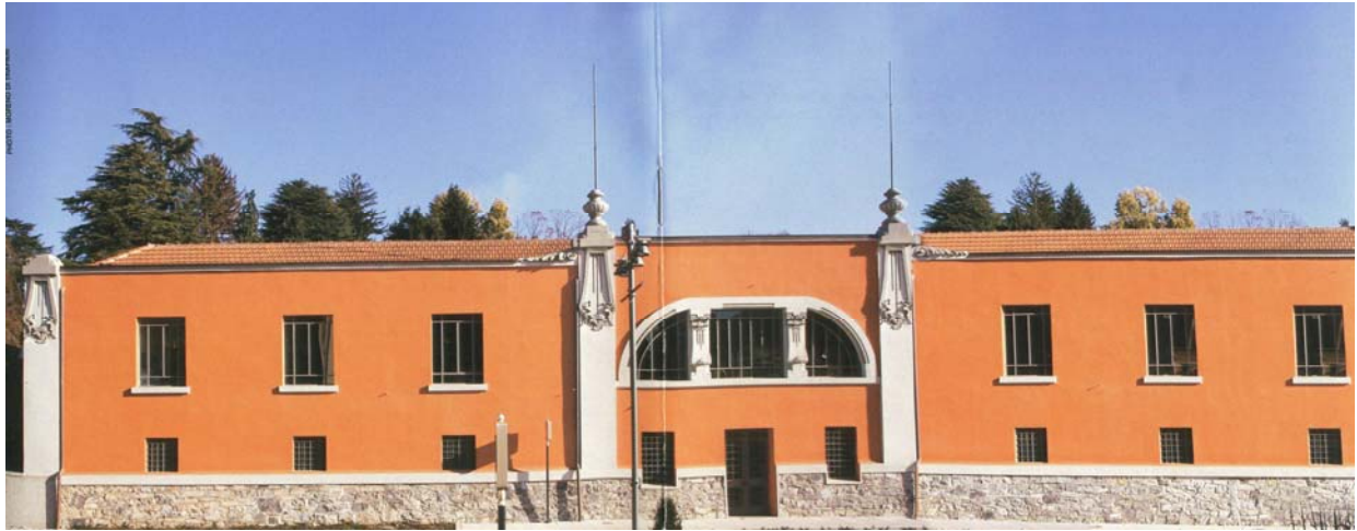
La facciata dell'attuale Centro Frera (ex fabbrica delle motociclette FRERA nel XX secolo)

A Tradate esisteva negli anni 1905-1936 la fabbrica delle motociclette FRERA